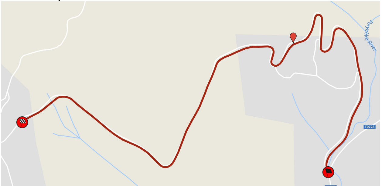
05.08.2018 Траса змагання - "Лумшори"